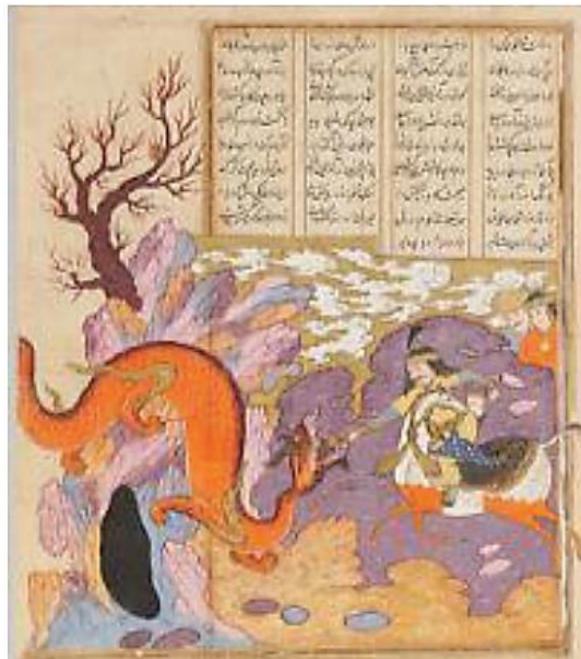
تصویر ۳. نبرد گشتاسب و اژدها. شاهنامه طهماسبی. مکتب صفویه - تبریز.

علاوه بر این، در بسیاری از اشعار شاهنامه که به توصیف اژدها اختصاص دارد، اژدها موجودی بزرگ و غول‌پیکر معرفی شده است. فردوسی به تناسب موقعیت‌ها و حوادث داستانی، شکل و شمایل اژدها را به سان موجودی تنومند و پیل‌پیکر تصویر کرده است. می‌توان گفت که تنومندی اژدها برای به تصویر کشیدن قدرت نیروی ماورایی پهلوانانی چون رستم و اسفندیار بوده است: