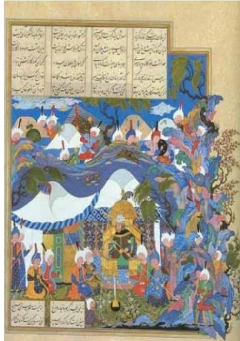
تصویر ۵: دیدار اسفندیار با رستم، شاهنامه بایسنقری، ۸۳۳ ه.ق. هرات.

رستم را به مهمانی دعوت می‌کنند و شکارگاهی را آماده می‌سازند که در آن شکارگاه چند چاه حفر نموده و ته چاه دشنه‌های تیزی قرار می‌دهند تا رستم به داخل یکی از این چاه‌ها بیفتد و بمیرد. رستم مهمانی برادرش را قبول می‌کند و بعد از مهمانی به شکار می‌روند و در نهایت رستم در داخل یکی از آن چاه‌های حفر شده توسط برادر روی دشنه‌ها می‌افتد و بدنش پاره‌پاره می‌شود. رستم از برادر درخواست تیری می‌کند که بدنش توسط ددان خورده نشود، شغاد هم قبول می‌کند و چند تیروکمان به رستم می‌دهد و رستم بلافاصله تیری را به سوی برادرکش نابکار می‌زند و از برادر کین‌خواهی می‌کند و خود نیز چند لحظه بعد می‌میرد (همان: ۳۸۸). می‌بینیم که او هم به‌مانند ایرج از فریب برادر آگاه نیست و فریب بدی‌ها و روباه‌صفتی او را می‌خورد. او از برادر خود شغاد - با رویی خرم استقبال می‌کند و او را از تخمه سام نیرم می‌داند. رستم برخلاف ایرج و اغریث، از جنگ پرهیزی ندارد. او پهلوانی است که در مقابل آشوب و نافرمانی سر فرود نمی‌آورد و جنگ را بهترین راه حل ممکن می‌داند.