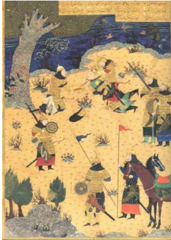
تصویر ۳: مرگ سیاوش، شاهنامه بایسنقری، ۵۸۳۳ق. هرات.

از دیدگاه اسطوره‌شناسی، «سیاوش نماد یا خدای نباتی است؛ زیرا با مرگ او، از خورشید گیاهی می‌روید» (گریمال، ۱۳۷۸: ۲۳ / ۱). «عزیزترین پهلوان شاهنامه است» (اسلامی ندوشن، ۱۳۴۸: ۱۷۳). به سبب رهایی از دسیسه‌های پی‌درپی سودابه زن کاووس، داوطلبانه به همراهی رستم برای نابودی تورانیان پیمان شکن به بلخ می‌رود. پس از نبردی دلاورانه برای جلوگیری از خونریزی و کشتار، با قراردادن شرایطی، تورانیان را به صلح می‌خواند. افراسیاب که دلاوری‌های سپاه ایران را تجربه کرده، بدون چون و چرا شرایط سیاوش را می‌پذیرد. صلح بین ایران و توران محقق نمی‌شود، چراکه کیکاووس، صلح را دلیل بر ضعف می‌داند و می‌خواهد تمام اسیران و گروگان‌های تورانی کشته شوند. پادرمیانی رستم نیز کارساز نیست. رستم با حالتی قهرگونه، کاووس را ترک می‌کند و سیاوش را نیز در مرز ایران و توران تنها می‌گذارد. سیاوش نمی‌خواهد فرمان پدر را انجام دهد. پس به دنبال دعوت پیران‌ویسه، سردار خردمند تورانی به سرزمین دشمن پناه می‌برد. افراسیاب از آمدن او استقبال می‌کند و پس از مدتی فضیلت‌های سیاوش او را تحت تأثیر قرار می‌دهد و مهر سیاوش سبب می‌گردد تا افراسیاب، همگان را فراموش کند (اسلامی ندوشن، ۱۳۴۸: ۱۷۷-۱۷۶).