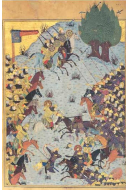
تصویر ۱: رزم کیخسرو و افراسیاب، شاهنامه بایسنقری.