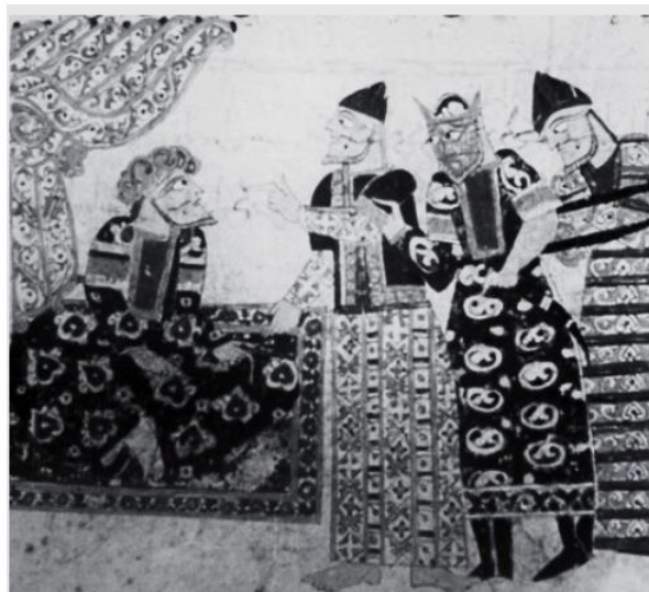
تصویر ۱: نگاره آیین و عقوبت عفو کردن در کتاب قابوس‌نامه.

او عبادت و بندگی را در سنین جوانی بارزش می‌داند و معتقد است پیر چاره‌ای جز پناه‌بردن به کنج عبادت ندارد: «قحبه‌ی پیر از نابکاری چه کند که توبه نکند و شحنه معزول از مردم‌آزاری. جوان گوشه‌نشین شیرمرد راه خداست/ که پیر خود نتواند ز گوشه‌ای بر خواست» (همان، ۱۹۰). عنصرالمعالی نیز طبق رسالتش در بیان فلسفه تربیتی برخی واجبات نظیر روزه می‌گوید: «و بدان که بزرگ‌ترین کاری در روزه آن است که چون نان روز به شب افکنی آن نان را که نصیب روز خود داشتی به نیازمندان دهی تا فایده رنج تو پدید آید» (عنصرالمعالی، ۱۳۹۰: ۱۹). او در جای دیگر نیز عالمانه می‌گوید صرف عبادت شرط نیست؛ بلکه اصل در عبادت «لزوم عبودیت محض» است (همان، ۲۳). «این قرائن نشان می‌دهد که روح و فرهنگ عنصرالمعالی آمیزه‌ای از فرهنگ ایرانی است که با فرهنگ اسلامی روزگار او چنان درهم‌تنیده شده است که تبیین حدومرز آن دو ساده نیست» (سبزیان پور، ۱۳۹۲: ۵۴). در تصویر زیر که مربوط به نسخه مصور قابوس‌نامه است به موضوع عفو و بخشایش اشاره شده است.