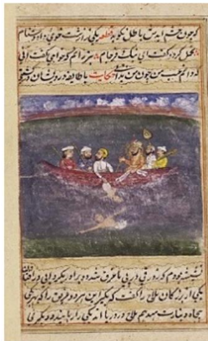
تصویر ۳: نگاره مربوط به مشورت کردن، در گلستان سعدی، نسخه موزه لندن.

همان گونه که در تصاویر بالا مشخص است هر دو ادیب ایرانی برای مقوله مشورت کردن و تفکر اهمیت به سزایی قائل بوده‌اند.