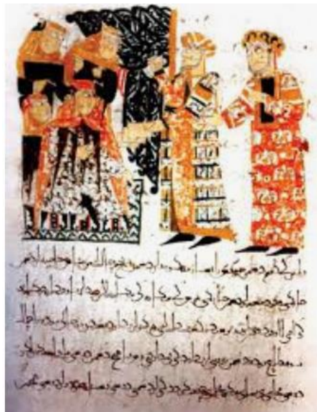
تصویر ۴-نگاره دوستی در قابوسنامه.

از مهم‌ترین آداب و مهارت‌های اجتماعی، مهارت دوست‌یابی و تداوم دوستی است. هر انسانی در مسیر زندگی اجتماعی خویش ناگزیر از یافتن دوست است و نوع‌دوستانی که برای خود برمی‌گزیند، چه‌بسا شخصیت او را در آینده شکل خواهد داد. «هم دست‌یافتن هنر است و هم دوست‌نگه‌داشتن؛ هم دوستی‌های تعطیل شده و به‌هم‌خورده را دوباره پیوندزدن و برقرار ساختن» (محدثی، ۱۳۸۹: ۱۷۵). اهمیت این موضوع تا آن‌جا است که خداوند متعال در قرآن کریم از جمله حسرت‌های جهنمیان را همراهی با دوستان ناشایست بیان می‌دارد: «يَا وَيْلَتَى لَيْتَنِي لَمْ أَتَّخِذْ فُلَانًا خَلِيلًا» (فرقان / ۲۸). تأثیر دوستان خوب در یکدیگر را سعدی در قالب شعری از زبان «گل خوشبوی» در دیباچه گلستان بیان می‌دارد (سعدی، ۱۳۷۷: ۵۱). عنصرالمعالی نیز در خصوص تأثیر دوست خوب، آن را به هم‌نشینی روغن کنجد با گل و بنفشه مثال می‌زند که به برکت این اختلاط و هم‌نشینی او هم نام گل به‌خود می‌گیرد: «صحبت جز با مردم نیک‌نام مکن که از صحبت نیکان، مرد نیک‌نام شود؛ چنان‌که روغن کنجد از آمیزش با گل و بنفشه که به گل و بنفشه‌اش باز می‌خوانند از اثر صحبت ایشان» (عنصرالمعالی، ۱۳۹۰: ۳۶). او پس از بیان لزوم دوست‌یابی، ویژگی‌های دوست خوب را نیز برمی‌شمرد: نیک‌نام، نیک‌اندیش و نیک‌آموز، شریک در غم و شادی، هم‌گف بودن، باخرد و دانا و بی‌طمع (همان، ۲۹ و ۱۴۰-۱۴۲). تصویر زیر مربوط به قابوسنامه به اصل دوست‌یابی اشاره کرده‌است.