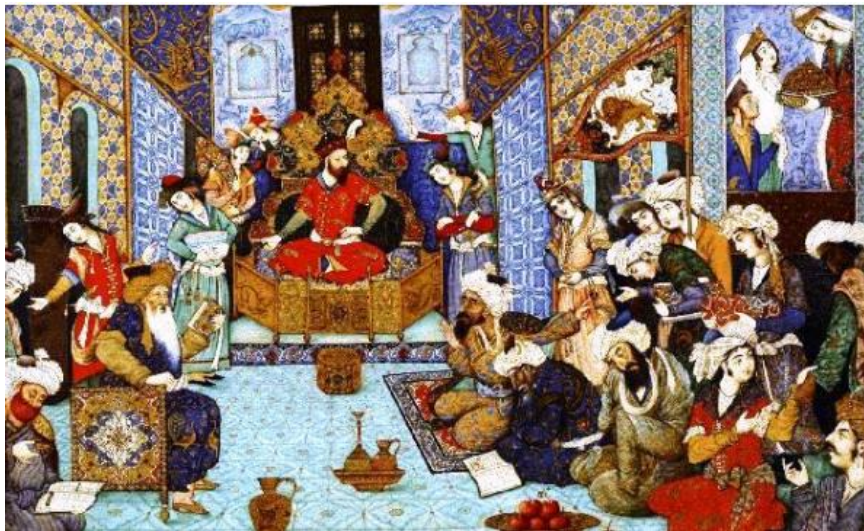
تصویر ۶: نگاره پادشاه در قابوسنامه.

عنصرالمعالی و سعدی به جهت اهمیت این امر، یکی از وظایف مهم حاکمان را تأمین معیشت لشکریان می‌دانند تا در زمان حادثه از بذل جان دریغ ندارند و صحنه را خالی نگذارند. «... لشکر خویش را همیشه دل خوش دار، اگر خواهی که جان از تو دریغ ندارند، تو نان از ایشان دریغ مدار» (عنصرالمعالی، ۱۳۹۰: ۲۲۶). سعدی نیز یکی از پادشاهان پیشین را حکایت می‌کند که در مملکت‌داری سستی داشت: «یکی از پادشاهان پیشین در رعایت مملکت سستی کردی و لشکر به‌سختی داشتی. لاجرم دشمنی صعب روی نمود، همه پشت دادند» (سعدی، ۱۳۷۷: ۶۸). البته عنصرالمعالی در سطوری مجزا برخی از آداب و مهارت‌های مهم نظامی و کارزار را بیان می‌دارد که در نوع خود قابل توجه است (عنصرالمعالی، ۱۳۹۰: ۲۲۶-۲۲۳). در تصویر زیر که مربوط به قابوس‌نامه است سلطان محمود غزنوی در کنار درباریان به تصویر کشیده شده است و نوعی گفتگو در مجلس جریان دارد.