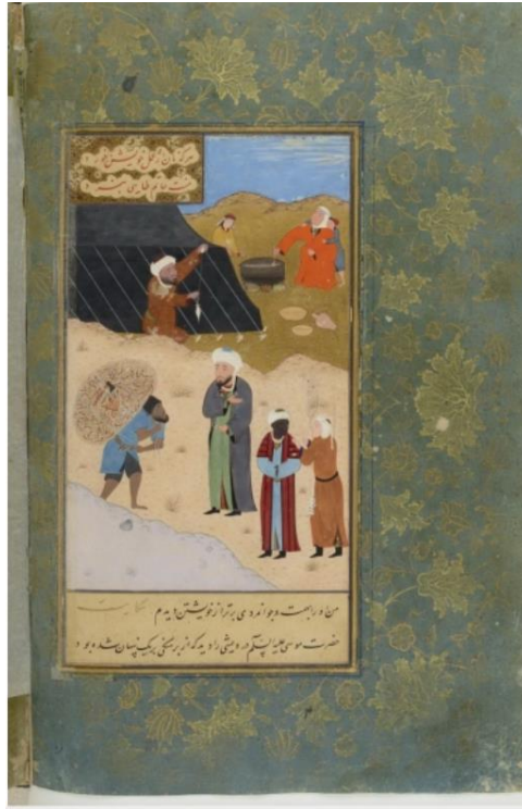
تصویر ۵: نگاره سبک زندگی در بوستان سعدی، نسخه چستربیتی لندن.

عنصرالمعالی که همیشه سعی داشته است فلسفه تربیتی هر مهارتی را بیان کند، به فلسفه انفاق از نگاه دینی به عنوان آزمایشی الهی نسبت به صاحبان نعمت اشاره می‌کند. او معتقد است انفاق ابتدا موجب رشد و کمال در انفاق‌کننده می‌شود و بعد گشایشی برای نیازمند. «... و خدای تعالی تقدیر کرد تا گروهی درویش باشند و گروهی توانگر و توانا بود بدان که همه را توانگر کردی و لکن دو گروه از آن کرد تا منزلت و شرفِ بندگان پدید شود و برتران از فروتران پیدا شود... مردم صدقه‌ده پیوسته در امن خدای تعالی باشند... و چون تو با کسی خوبی کنی، بنگر که در وقت خوبی کردن هم چندان راحت که بدان کس رسد در دل تو خوشی و راحت پدید آمد» (عنصرالمعالی، ۱۳۹۰: ۲۲-۲۹). او با نگاهی انسانی و اخلاقی بر این باور است که انفاق نسبت به دشمن نیازمند هم جایز است؛ چراکه شاید این امر موجب مودت در دل دشمن گردد: «و اگر هم جنسی از تو را شغلی اوفتد، ناچار از بهر او بکوش، رنج تن و مال دریغ مدار؛ اگرچه دشمن و حاسد تو باشد...» (همان، ۴۰).