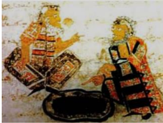
تصویر ۲. نگاره درباره اندیشه کردن در قابوس نامه. منبع: (نصیری، ۱۳۹۵: ۳۷)