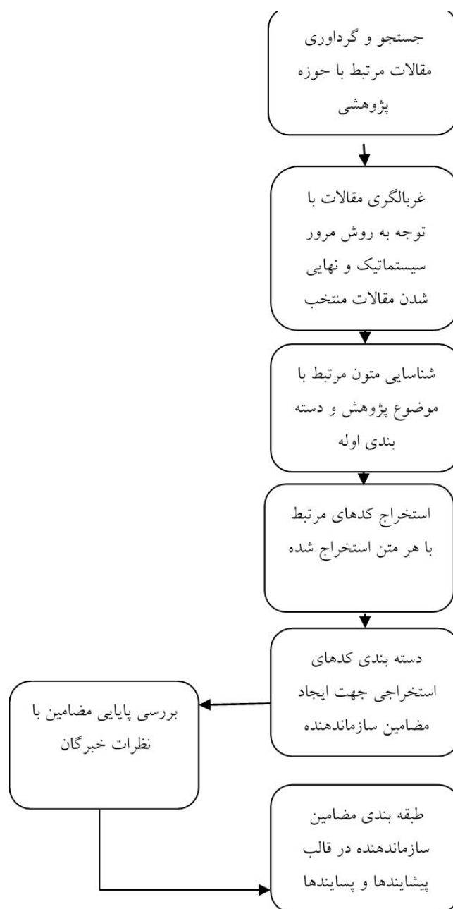
شکل ۲- روند انجام تحقیق